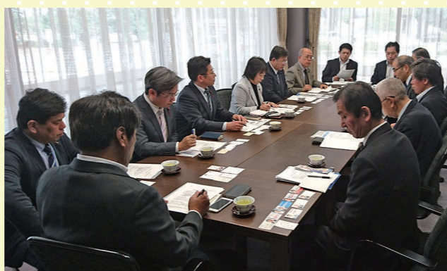
千葉県社会労務士会との意見交換

自治体における指定管理者等において、労働法令の遵守や雇用・労働条件の適切な配慮が求められています。そのようなことから、県内他市で採用されている社会保険労務士による労働条件審査の導入について、千葉県社会労務士会の皆さんと意見交換を行いました。