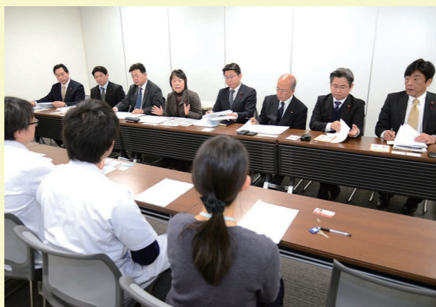
千葉市認知症疾患医療センターとの意見交換

市議団として、千葉大学医学部附属病院に開設されている千葉市認知症疾患医療センターで、医師や臨床心理士の方々と意見交換を行いました。10年後、20年後の未来を見据えた認知症の人を支える街づくりが必要と、小・中学生を対象に、認知症を正しく理解するためのワークショップなどを行う「千葉市認知症こどもカプロジェクト」の取り組みについての説明をいただきました。広く一般の市民が参画する認知症対策の必要性を伺い、今後の施策展開の参考とさせていただきました。